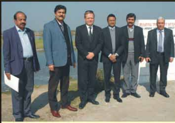
ڈینٹس وفد ایم ڈی واسا کے ہمراہ ٹریڈیشنل پونڈز چکیرہ کا دورہ کرتے ہوئے۔